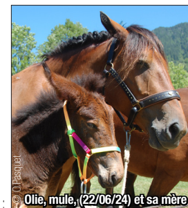
Olle, mule, (22/06/24) et sa mère