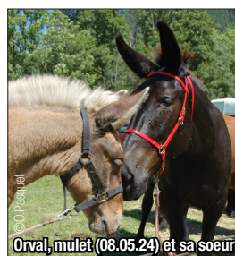
Orval, mulet (08.05.24) et sa sœur