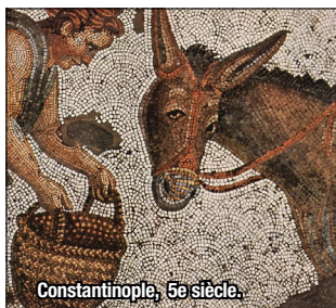
Constantinople, 5e siècle.